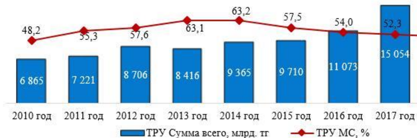
Рисунок 7. Динамика показателей регулируемых закупок и местного содержания в них за 2010-2018 годы

Анализ регулируемых закупок товаров, работ и услуг (государственные закупки, закупки национальных компании и холдингов, закупки недропользователей – закупки субъектов мониторинга) показал, что по республике с 2010 по 2018 годы при общем росте объемов закупок в 2,4 раза в целом, произошел рост доли местного содержания с 48,2% до 50,6%. При этом наибольший показатель местного содержания приходится на 2014 год (доля местного содержания – 63,2%) с резким снижением в 2015 году на 5,7% и дальнейшим ежегодным понижением.