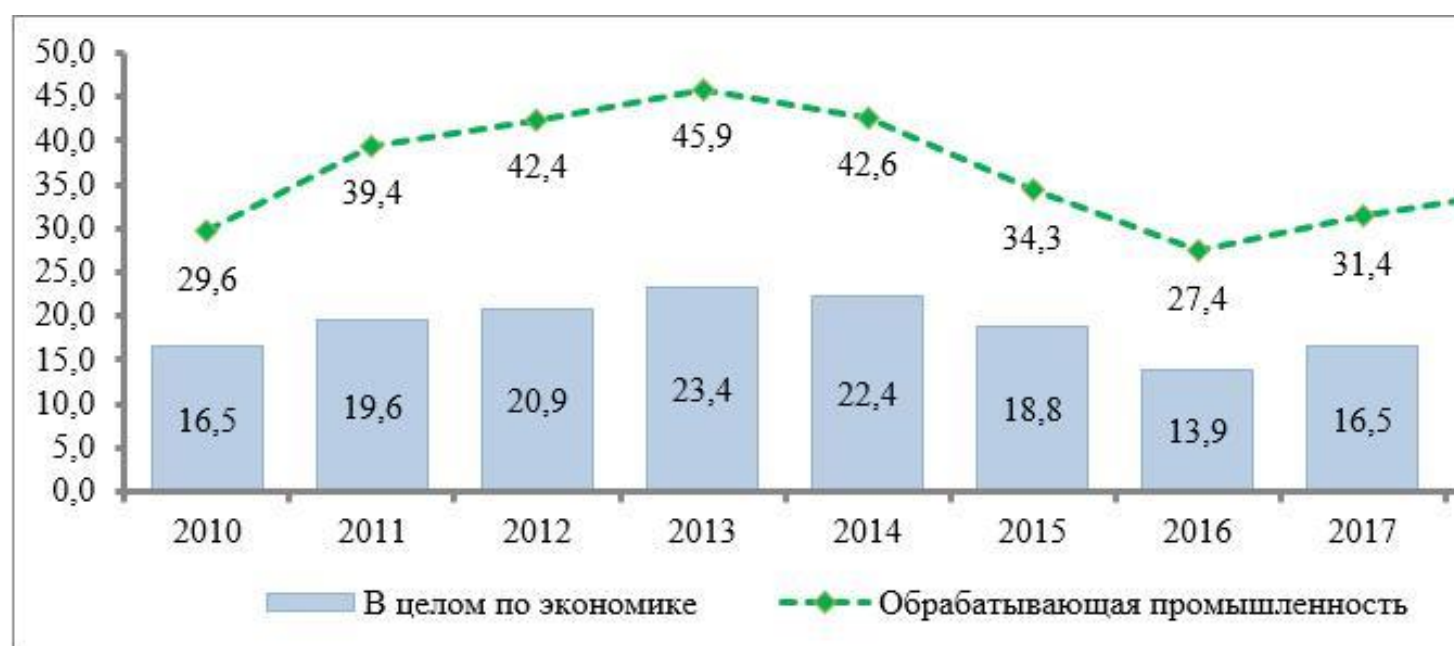
Рисунок 4. Производительность труда в целом по экономике, промышленности и отраслям промышленности Республики Казахстан в 2010 – 2018 годы, тыс. долларов США/чел.

долларовом выражении составил в 2018 году 35,3 тыс. долларов США (для сравнения: в 2013 году – 45,9 тыс. долларов США). Кроме того, согласно оценке международных экспертов, одной из причин низких темпов роста производительности труда является несфокусированная государственная поддержка, охватывающая в т.ч. неэффективные компании 7 .