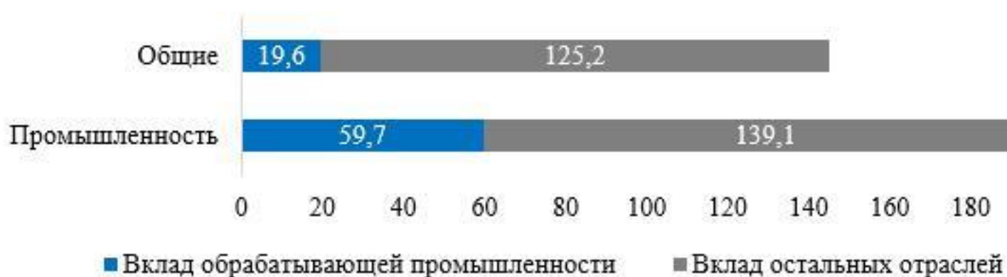
Рисунок 6. Декомпозиция накопленных темпов роста инвестиций в основной капитал по всей экономике и промышленности за 2010-2018 годы, в %

Приток инвестиций в основной капитал обрабатывающей отрасли в разрезе всей экономики и промышленности сопоставим со вкладом обрабатывающей промышленности в валовый внутренний продукт страны и промышленности, в целом, за анализируемый период. Так, за анализируемый период инвестиции в основной капитал (в текущих ценах) по всей экономике и промышленности кумулятивно выросли на 144,8 % и 198,8 %, соответственно. Из них 19,6 п.п. и 59,7 п.п. приходятся на обрабатывающую промышленность.