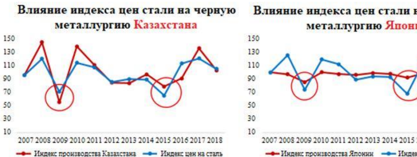
Рисунок 2. Сравнение влияния индекса цен стали на черную металлургию в Казахстане и Японии.