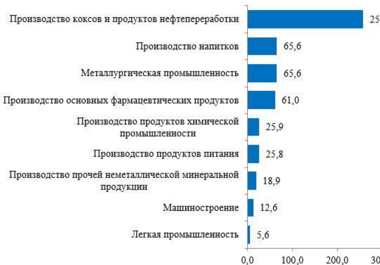
Рисунок 5. Производительность труда по отдельным видам экономической деятельности обрабатывающей промышленности Республики Казахстан в 2018 году, тыс. долларов США/чел.

7 Всемирный банк, доклад "Преодоление стагнации производительности"